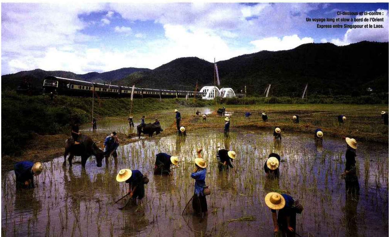
Ci-dessous et ci-contre : Un voyage long et slow à bord de l'Orient Express entre Singapour et le Laos.